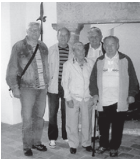
■ Delegace účastníků zájezdu v útrokách hradu.