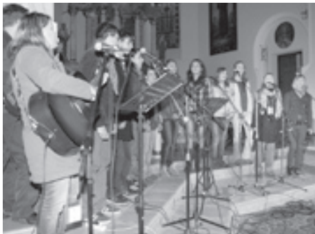
■ Scholy nacvičovaly v ZŠ Vrchlického i v radvanickém kostele.