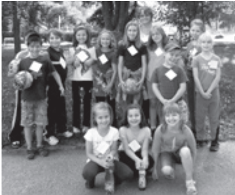
■ Noci v družině předcházely soutěže.

Na konci školního roku paní vychovatelka Lenka Laštuvková dětem z družiny slíbila, že za skvělou reprezentací školy v hale Sareza na celoostravské přehlídce ŠD uspořádá pro děti „Noc v družině“. Sešli jsme se v podvečer v naší krásné družince a zkoušeli nové hry. Pak jsme zašli na hřiště za školu a zahájili jsme závody družinek.