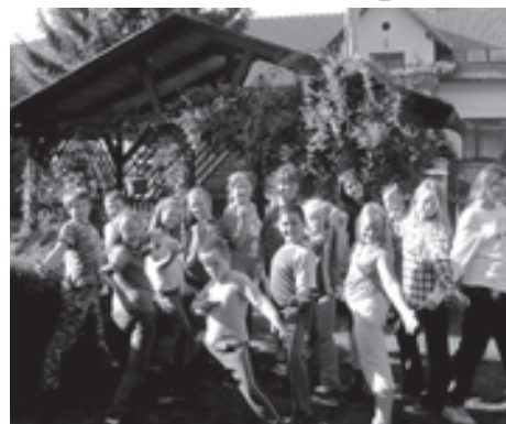
■ Foto v příjemném zákoutí zahradní pergoly nemohlo chybět.

Tam jsme se rozdělili do 2 soutěžních skupinek- Avataři a McDonaldi. Hráli jsme zejména slovní hry, rozvíjeli jsme slovní zásobu a také se učili pracovat na počítači. Na našem skvělém výletě totiž probíhalo i školení redaktorů. Pak jsme si předvedli svá herecká, pěvecká nebo taneční umění. Nejvíce mne asi bavily hry, v nichž jsme museli předvádět či vymyslet pokřik, reklamu či film. Odpoledne vypukly i sportovní a míčové soutěže. Táborák nesměl chybět, zpívalo se a opékali jsme si párky. Později večer proběhla stezka odvahy. Dětila se na různé skupiny podle toho, na co si kdo troufal. Někteří šli jen kolem chalupy, jiní k obchodu nebo až na hřbitov. Já měla jít až na hřbitov, ale tu noc v obci jezdili řidiči jak utržení ze řetězu, tak to paní vychovatelka nedovolila. Skvělé jídlo nám vařila nejhodnější maminka Kateřina Štrochová, která je již léta patronkou naší družiny.