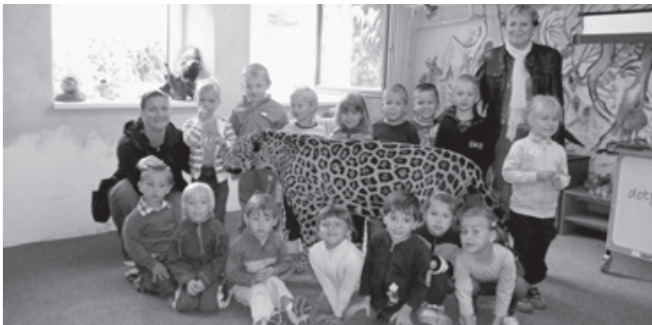
■ Děti z mateřské školy se vyfotily s levhartem.

V pátek 23. září již od rána zněly mateřskou školou Ještěrka písničky o zvířátkách, a to proto, že se děti ze všech tříd chystaly na výlet do Zoologické zahrady v Ostravě. Když děti s učitelkami přijely do ZOO, tak se rozdělily do tří různých skupin.